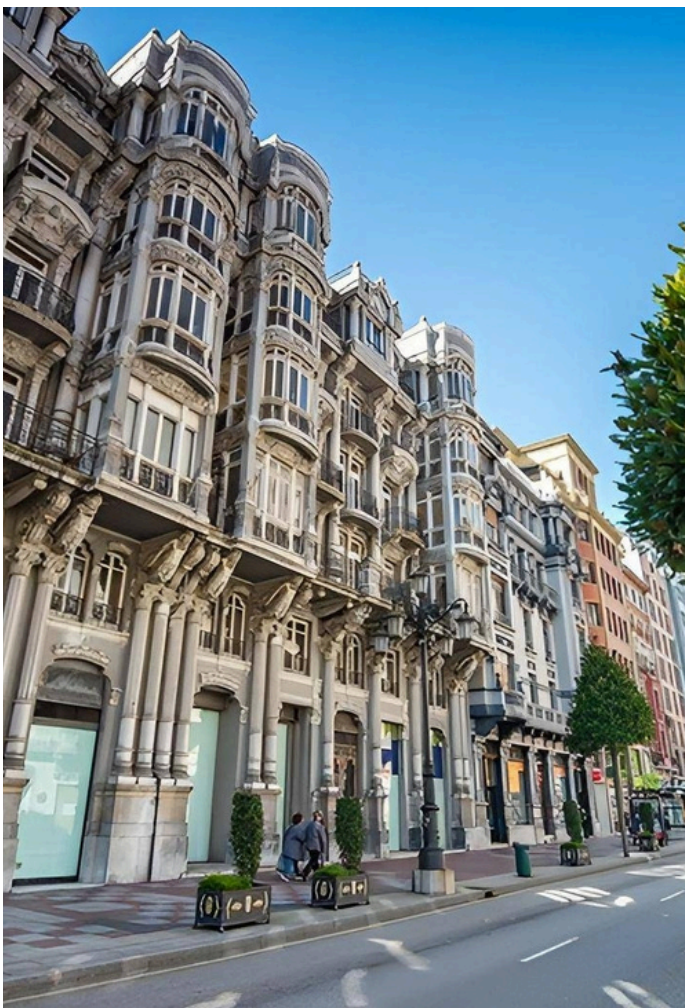
Calle Uría, en Oviedo

Asimismo, tanto para el Coloquio Internacional en Ereván, Armenia (del 15 al 18 de abril de 2025) como para el LIX Congreso Internacional de la AEPE (del 22 al 25 de julio de 2025) se están preparando páginas web específicas. Cuando estén finalizadas, se informará pertinente de ello tanto mediante correo electrónico a todos los socios.