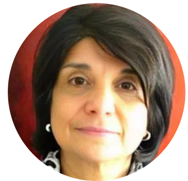
CONTABILIDAD AEPE Y RECORDATORIO DE PAGOS HORTENSIA MALFITANI-LUDWIG UNIVERSIDAD DE COLONIA (COLONIA, ALEMANIA)