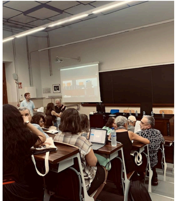
Preparativos antes de la ceremonia de apertura del LVIII Congreso Internacional de la AEPE en Barcelona

Inmersos ya plenamente en el nuevo curso académico, con su vorágine de clases, actividades, reuniones... queda, como un lejano recuerdo, nuestro encuentro en Barcelona, con motivo de la celebración del LVIII Congreso Internacional de la AEPE. Ahora bien, estamos seguros de que ha dejado un poso permanente: por un lado, sigue vivo y nos estará siendo de utilidad todo lo que aprendimos aquellos días, pues nos está sirviendo para poner al día nuestros conocimientos; por otro lado, lo que disfrutamos conviviendo e intercambiando experiencias con otros colegas y socios de la AEPE permanecerá imborrable en nuestro recuerdo y en nuestro ánimo.