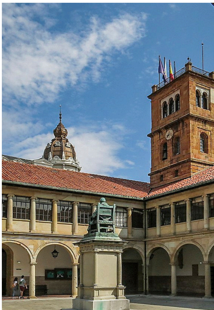
Claustro del edificio histórico de la Unviersidad de Oviedo

En cuanto Alicante, la imposibilidad de realizar el congreso en 2025, lo motiva, como ya se apuntó durante la discusión en la Asamblea, que en la Universidad de Alicante se celebra en junio de 2025 otro congreso de lengua y la carga de trabajo que supondría