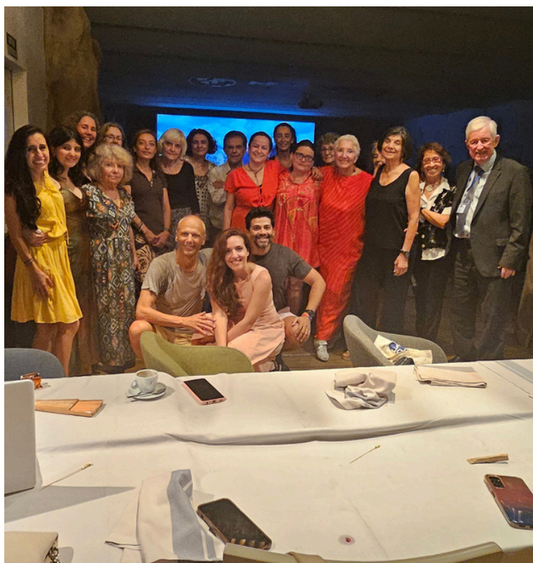
Participantes en la cena de clausura del congreso