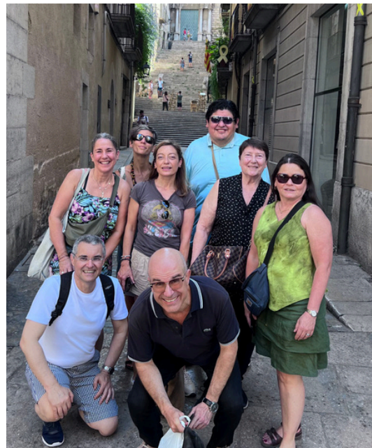
De excursión por las calles del casco antiguo de Gerona