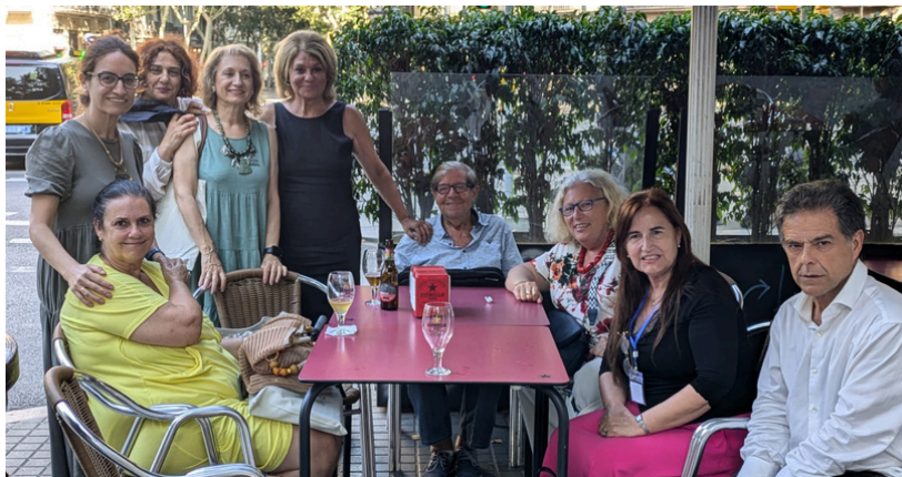
Tardeando, tras recoger las acreditaciones y documentación, el lunes 15 de julio.

de los miembros del comité organizador local por la acogida que nos dispensaron, así como por todos los medios humanos y logísticos que pusieron a nuestra disposición para que la celebración y el desarrollo del congreso fuera un éxito. Debajo pueden verse algunas fotografías facilitadas por diversos socios: