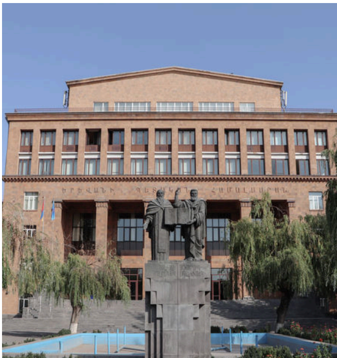
Universidad Estatal de Ereván, sede del próximo Coloquio Internacional de la AEPE

Asimismo, durante la Asamblea General en Barcelona: