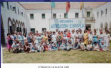
CONGRESO LA MESA (1981)