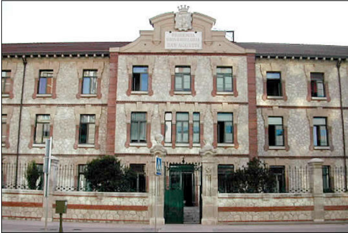
RESIDENCIA DE SAN AGUSTÍN