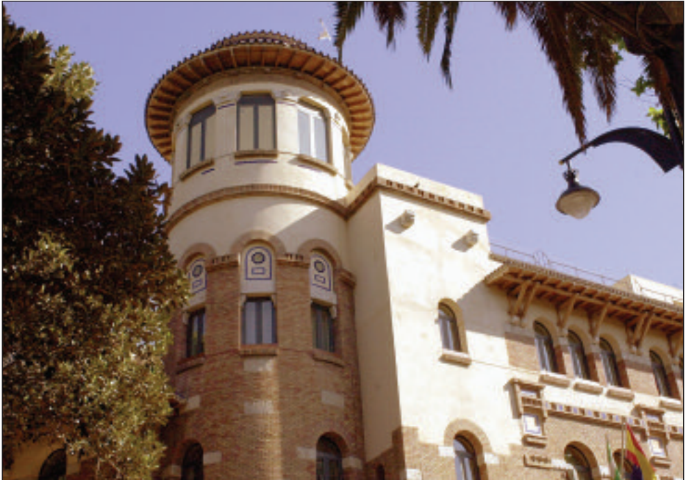
Rectorado de la Universidad de Málaga