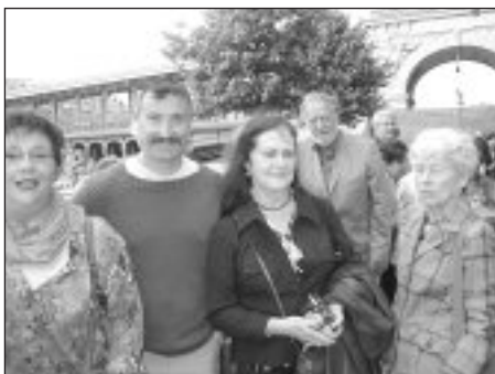
A punto de embarcar en el "Capitaine Fracasse."