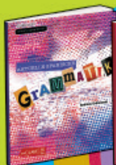
Colección ¡Viva la gramática!