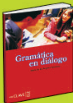
Colección En diálogo