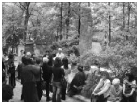
Homenaje en su tumba a Miguel Ángel Asturias.