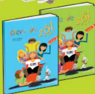
Clave de sol