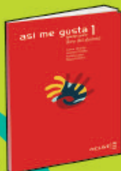
Así me gusta