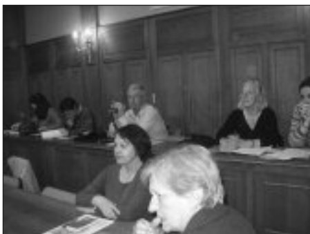
Sesión de trabajo en la Sorbonne.