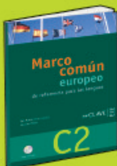
Colección EL Marco