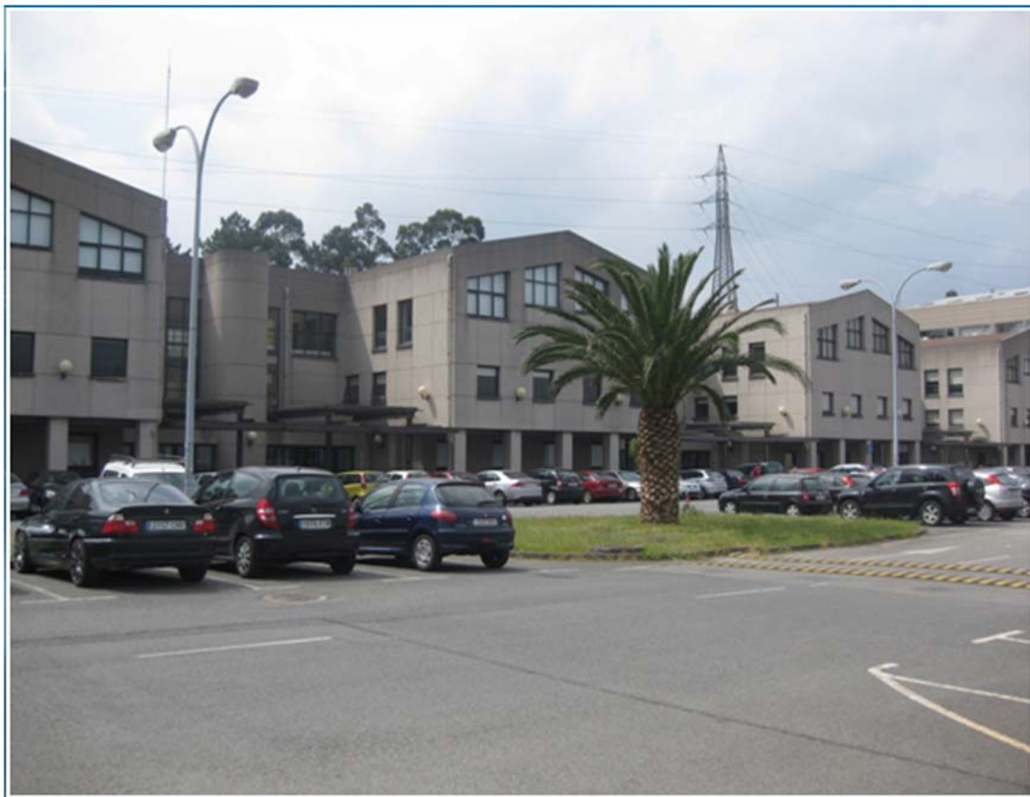
Facultad de Filología de la Universidad de A Coruña