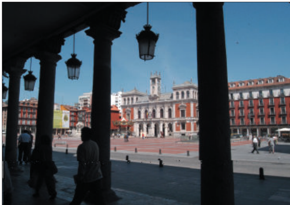
Plaza Mayor de Valladolid