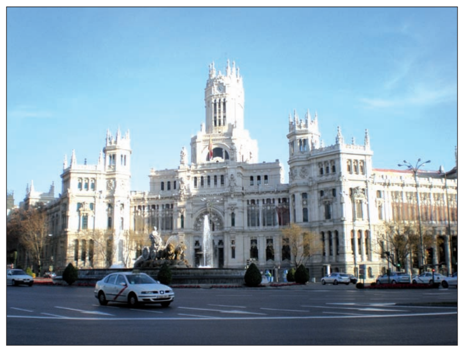
Plaza de la Cibeles y nuevo Ayuntamiento de Madrid