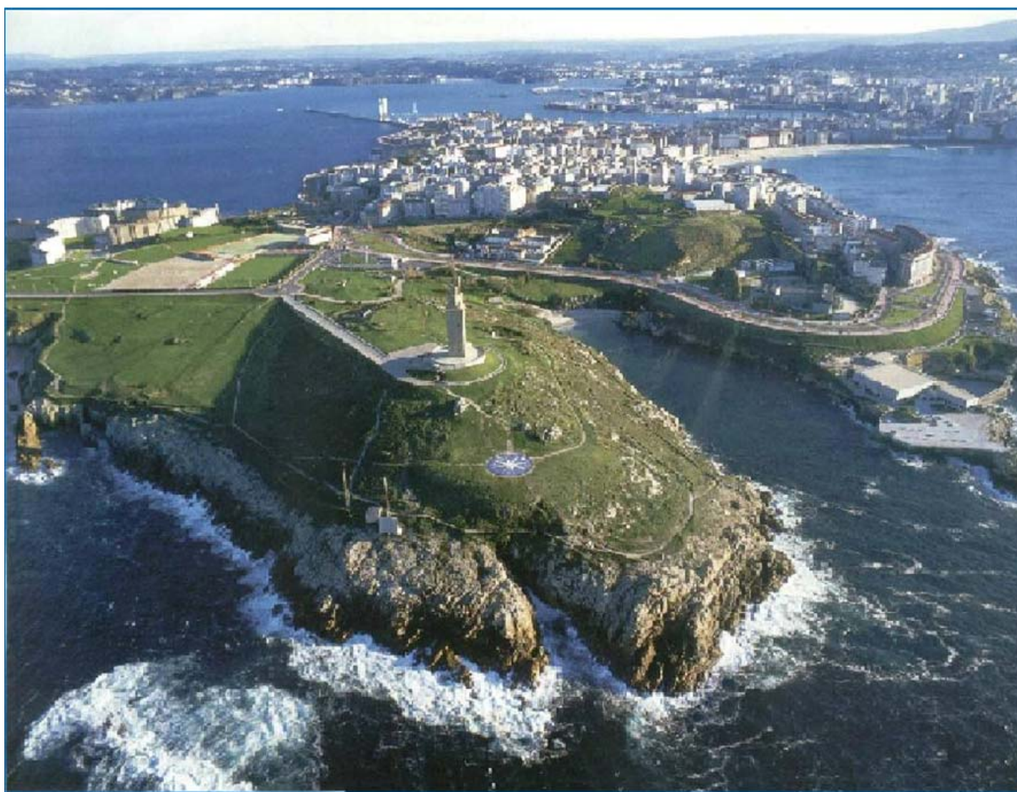
Torre de Hércules en A Coruña

COLABORA: LA UNIVERSIDAD DE A CORUÑA (UDC)