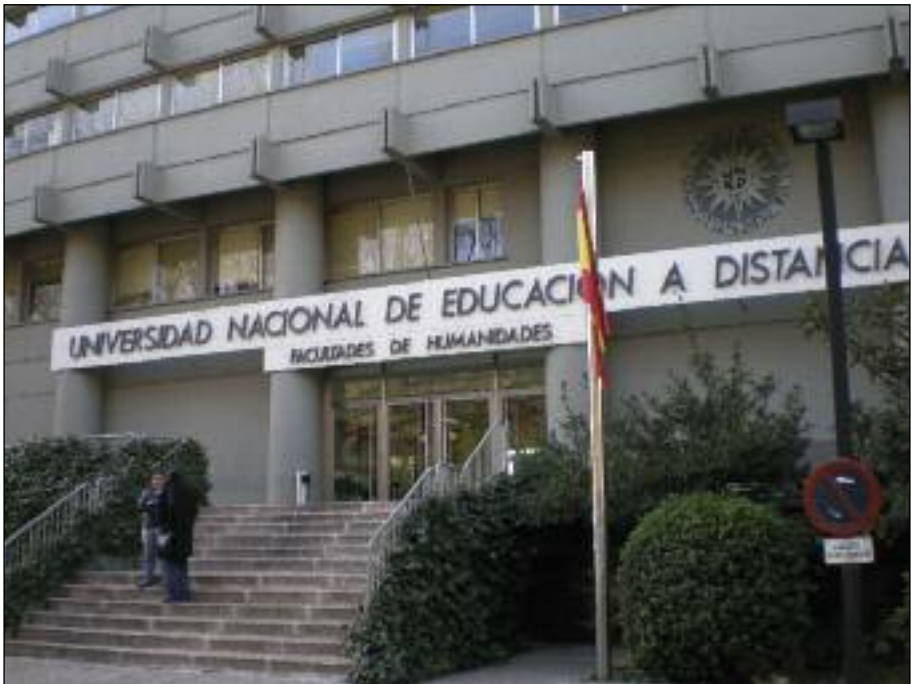
Edificio de Humanidades, UNED, Campus Senda del Rey

XLIII CONGRESO INTERNACIONAL DE LA AEPE Universidad Nacional de Educación a Distancia (UNED) Inauguración Instituto Cervantes, 28 de julio de 2008 Madrid, 27 de julio al 1 de agosto, 2008